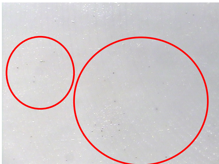
Foto 2: Untersuchungsmaterial Reca S 78 weiß nach einer Inkubationszeit von 28 Tagen mit geringem Pilzwachstum (50fach vergrößert)